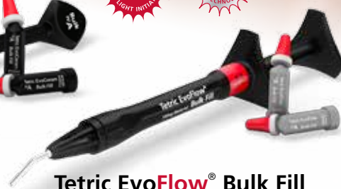
Tetric EvoFlow® Bulk Fill