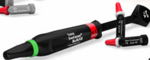
Tetric EvoCeram® Bulk Fill